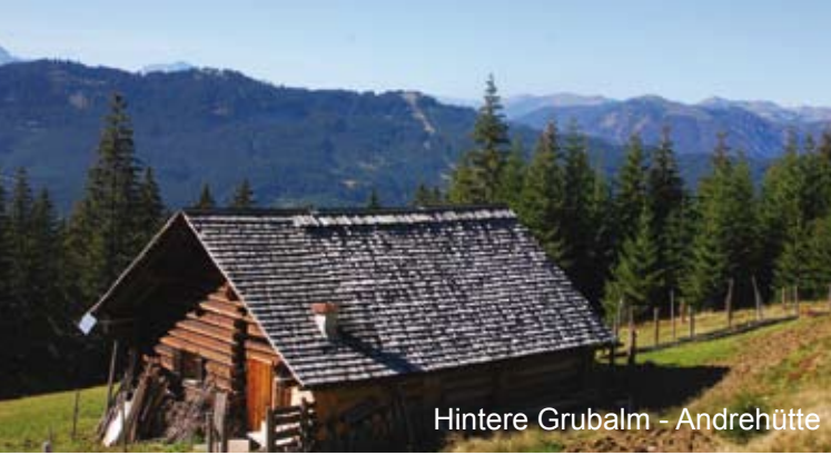
Hintere Grubalm - Andrehütte