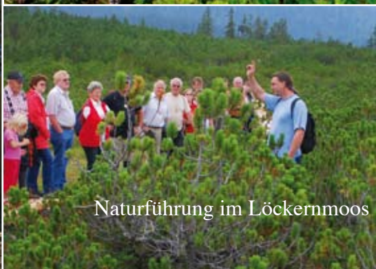
Naturführung im Löckernmoos